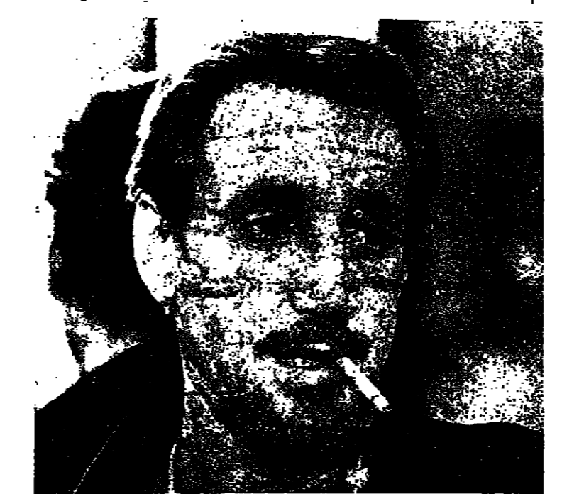
روي شويدرييل «كل ذلك الجاز» (الولايات المتحدة)

والمرأة في المهرجان كانت حاضرة عبر العديد من المشاكل ، في «الشرقة» مصاصب حياة ثلاث من شخصيات الفيلم تاتي عبر غراميات غاشلة بينها الرجال نحو نسانهم دون ان يجدوا تجاوباً كليا بتحقيق السعادة المنشودة . في «من اللاشي» المشكلة في فتاة شابة تشهد تدهم بيتها العائلي بسبب اب طائش وام غير مبالية ، أما في «اسبوع عطلة» احد الامم السلام الفرنسية المشتركة ، فالوضع يدور حول معلمة مدرسة تكتشف ان عليها اعادة ترتيب حياتها ، وفي «الوريتان» امام حياة امرأتين تتعاونتان على حل معضلتها في تفهم وحنو عجيبين .